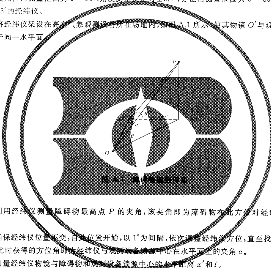
图 A.1 障碍物遮挡仰角

A.1.2 将经纬仪架设在高空气象观测设备所在场地内，如图 A.1 所示，使其物镜 O' 与观测设备馈源中心 O 处于同一水平面。